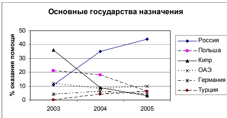
Схема 1: Основные государства назначения для жертв торговли людьми из Беларуси.

С 1 января 2001 г. по 8 июня 2005 г. Беларусь направила запросы о данных по 143 делам, связанным с торговлей людьми, в различные правоохранительные органы аналогичного профиля в других странах. Эти 143 случая можно разделить на информационные запросы (75 дел) и официальные просьбы о юридической взаимопомощи (68 дел). В приведенной ниже таблице они распределены по странам.