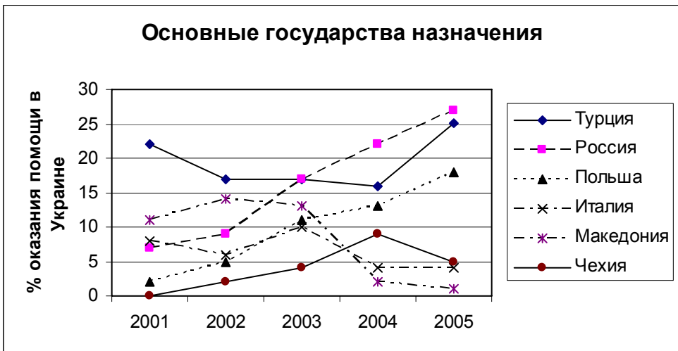
Схема 2. Основные государства назначения для жертв торговли людьми из Украины

Среди людей, которым МОМ помогла в Украине в 2004–2005 гг., 34 % стали жертвами торговли людьми с целью трудовой эксплуатации, еще 2 % – с целью принуждения к попрошайничеству; в одном случае целью незаконного переме-