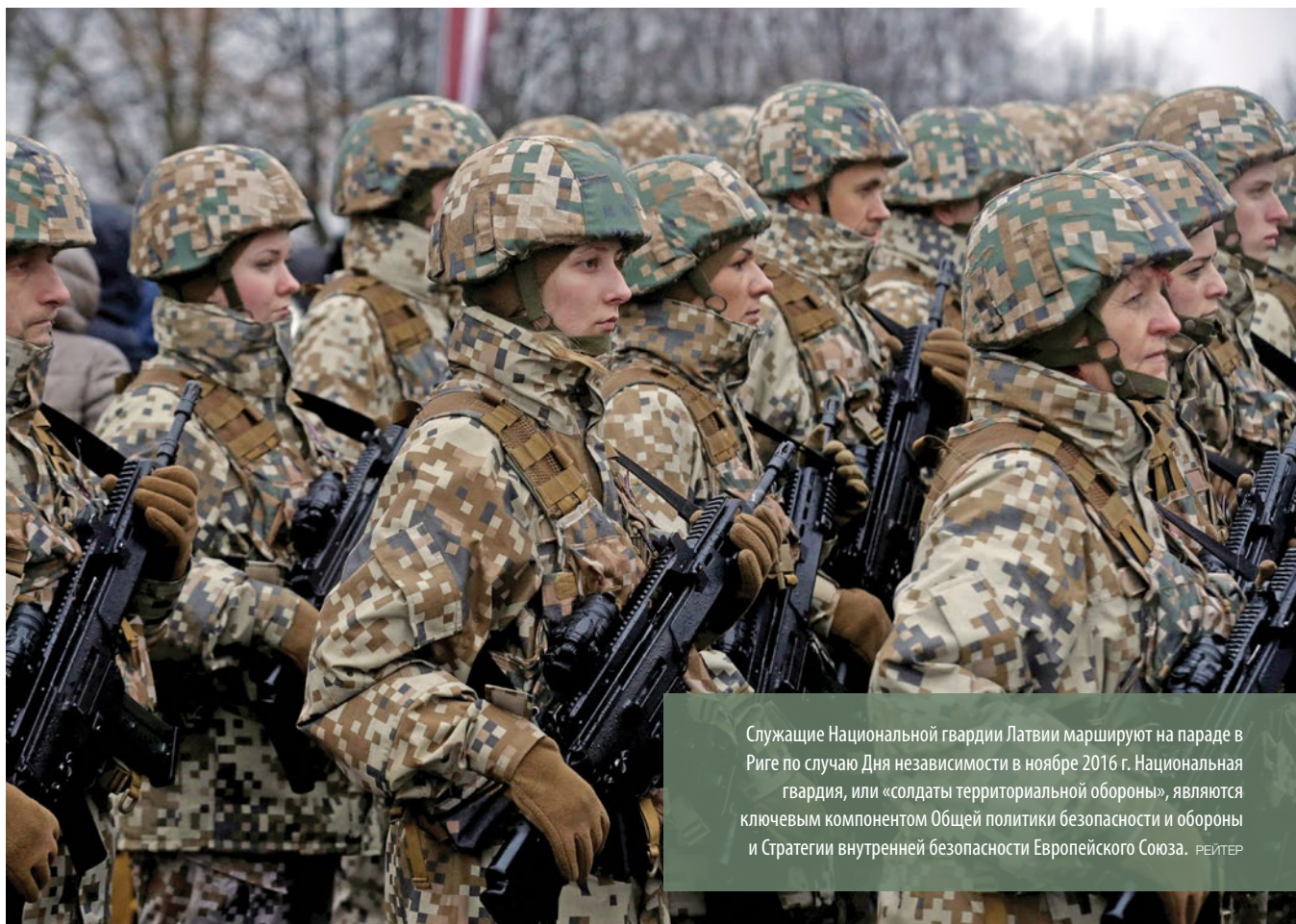
Служащие Национальной гвардии Латвии маршируют на параде в Риге по случаю Дня независимости в ноябре 2016 г. Национальная гвардия, или «солдаты территориальной обороны», являются ключевым компонентом Общей политики безопасности и обороны и Стратегии внутренней безопасности Европейского Союза.

ответы четко расставили приоритеты: «Защита страны/территории» оказался на первом месте с отметкой 94% опрошенных, далее следовал «Оказывать стране помощь в случае стихийного бедствия» с результатом 91% опрошенных.