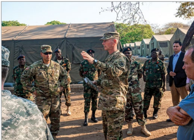
Подполковник сухопутных сил США Эд Уильямс, военный атташе в посольстве США в Малави, рассказывает об истории миротворческого учебного центра в Военном училище Малави во время планирования встречи в верхах представителей сухопутных сил Африки в г. Салима в Малави. Октябрь 2016 г.