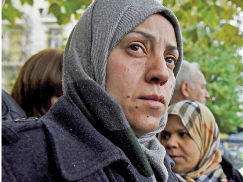
Женщины-беженки выступают за улучшение жилищных условий в греческом городе Салоники в ноябре 2016 г. Женщины недостаточно представлены на мирных переговорах, что отражается на качестве их жизни.

Мы должны признать, что участие и вовлеченность женщин в сферу безопасности, и особенно в мирные процессы, не является панацеей в борьбе за прекращение