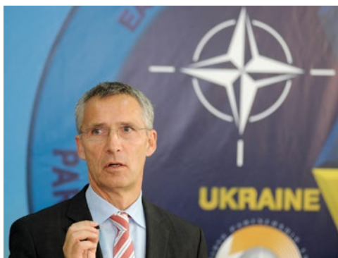
Генеральный секретарь НАТО Йенс Столтенберг выступает на пресс-конференции на полигоне «Яворив» на Украине.

Неприкрытая агрессия России в восточной Украине и уроки других локальных конфликтов четко демонстрируют, что в условиях современной гибридной войны безопасность Украины основывается на участии организаций коллективной безопасности. Хотя основной причиной, по которой Россия спровоцировала конфликт в восточной Украине, было стремление помешать сближению нашей страны с Европейским союзом, Украина недвусмысленно выбрала путь дальнейшей интеграции с ЕС и членство в НАТО.