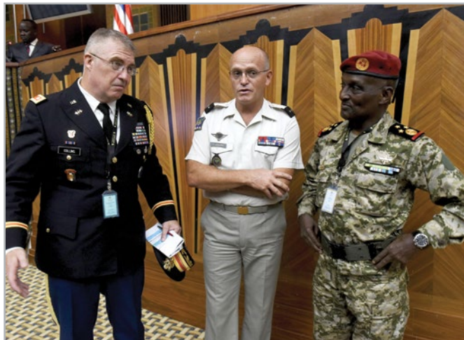
Подполковник Чарльз Коллинз, американский военный атташе в Сенегале, слева, беседует с генерал-майором Луи Дуйхау Луи, командующим французским контингентом в Сенегале, в центре, и офицером Сенегала на встрече в верхах сухопутных сил Африки, на которую приезжают начальники штабов сухопутных сил африканских стран и которая организована Командованием США по африканскому континенту.

предусмотрены последствия имплементации второго и третьего порядка, те что относятся к неправительственным организациям, к научно-исследовательским компаниям и разработчикам, корпоративным служащим и партнерам из частного бизнеса.