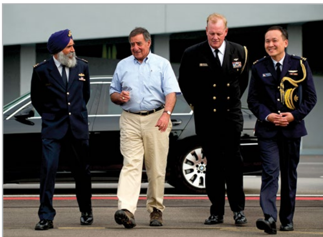
Капитан Джон Вуд, американский военный и военно-морской атташе в Сингапуре, второй справа, идет вместе с тогдашним министром обороны США Леоном Панеттой, второй слева, сингапурским полковником Сарбджитом Сингхом, слева, и американским генерал-майором Чи Ви Таном в Сингапуре в июне 2012 г. Военные атташе играют ключевую роль в военной дипломатии Соединенных Штатов.