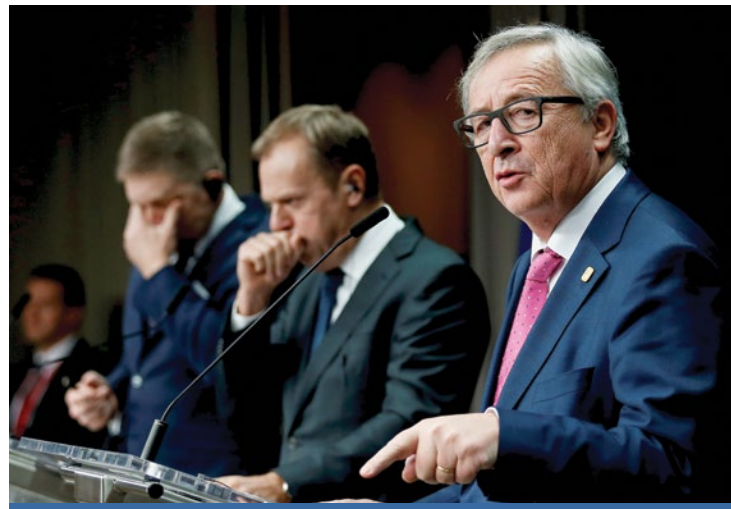
Президент Европейской комиссии Жан-Клод Жанкер проводит совместную пресс-конференцию с Президентом Европейского совета Доналдом Таском, в центре, и премьер-министром Словакии Робертом Фицо во время саммита руководителей стран Европейского союза в Брюсселе, Бельгия, в декабре 2016 г.

Конечно же, выход Великобритании является очень