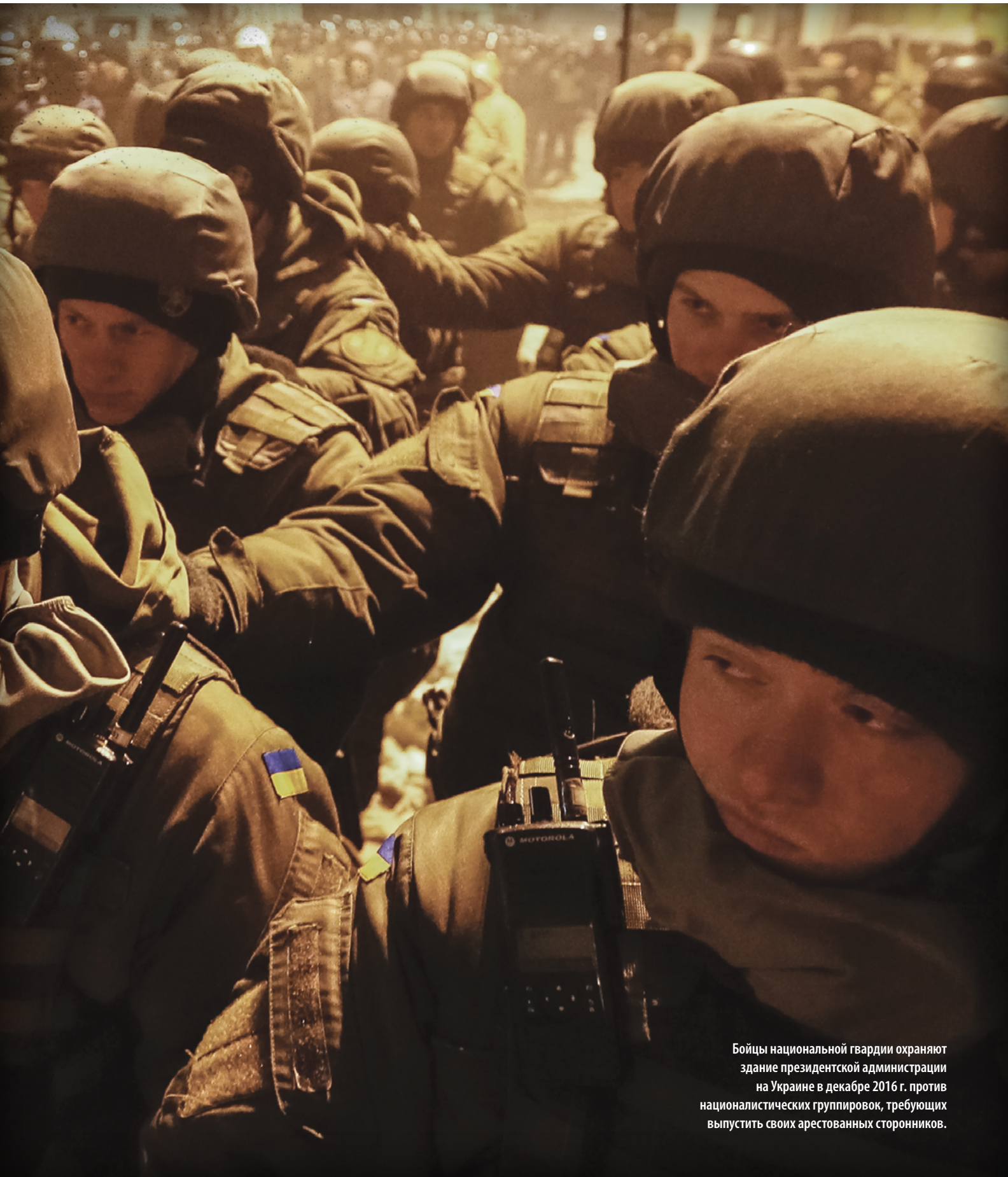
Бойцы национальной гвардии охраняют здание президентской администрации на Украине в декабре 2016 г. против националистических группировок, требующих выпустить своих арестованных сторонников.