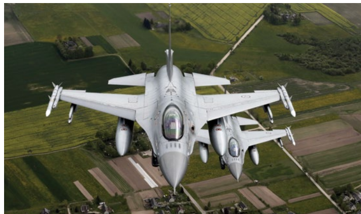
Истребители F-16 ВВС Норвегии патрулируют над странами Прибалтики, вылетов на это задание НАТО слитовской базы ВВС Зокниай неподалеку от г. Шяуляй.

Несмотря на более низкие показатели в целом по сравнению с НАТО, у России есть возможность создавать локальный перевес в тактическом соотношении сил и использовать фактор ядерной угрозы для доминирования при эскалации конфликта. Учитывая это, как могут силы альянса оказать сдерживающее влияние?