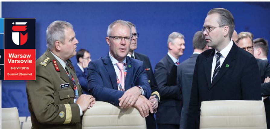
Слева направо: Начальник обороны Эстонии генерал-полковник Рихо Террас, министр обороны Эстонии Ханнес Хансо и министр обороны Финляндии Джусси Ниинисто беседуют на встрече министров обороны, посвященной вопросам взаимодействия, на саммите НАТО в Варшаве, Польша, в июле 2016 г.