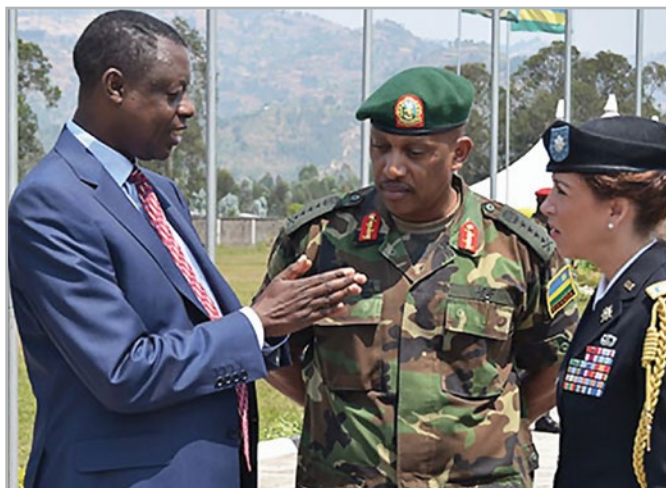
Слева направо: тогдашний министр обороны Руанды генерал Джеймс Кабаребе, начальник штаба обороны Руанды генерал Патрик Ньямвумба и американский военный атташе подполковник Гвин Карвер беседуют после официального открытия учебного курса для командования и штаба Сил обороны Руанды.

качестве одной из основных политических инициатив он выразил намерение сформулировать определение, а затем создать и развивать «Силы будущего». Это было представлено как усилие, направленное на приведение американских сил в наилучшее положение с учетом будущего с вызовами, на которые придется отвечать, и в которой оперативная обстановка будет, скорее всего, определяться размытыми параметрами времени и пространства, а не более конкретными физическими формами.