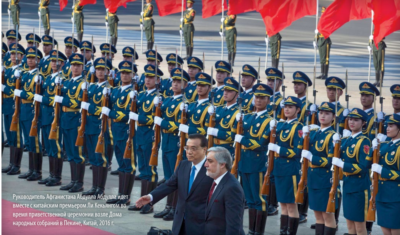
Руководитель Афганистана Абдулла Абдулла идет вместе с китайским премьером Ли Кэцянгом во время приветственной церемонии возле Дома народных собраний в Пекине, Китай, 2016 г.

ответственность за Афганистан, особенно, когда важные стратегические цели совпадают. Китайское партнерство не представляет существенной угрозы американским интересам и должно служить достижению долгосрочных стратегических целей.