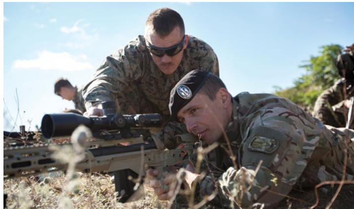
Американские и украинские морские пехотинцы стреляют из снайперской винтовки M-40 A-6 во время учений «Платиновая рысь» на полигоне Бабадаг в Румынии в сентябре 2016 г. Эти учения позволяют проводить совместную подготовку военных из стран-членов НАТО и стран-партнеров.

У альянса есть силы и возможности обеспечить сдерживание комбинированным способом, но использоваться они должны не так, как они использовались после окончания «холодной войны». НАТО необходимо начать с осознания понятия коллективной обороны внутри альянса.