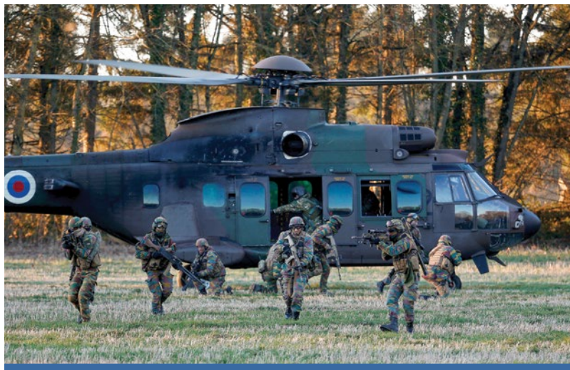
Высадка бельгийского спецназа во время учений «Черное лезвие» в ноябре 2016 г. на бельгийской базе ВВС возле г. Флореннес, в котором участвовали несколько стран Европейского союза, и которое было организовано Европейским оборонным агентством.

Призыв к союзу в сфере безопасности – это тщательно выбранный проект, поскольку он задей-