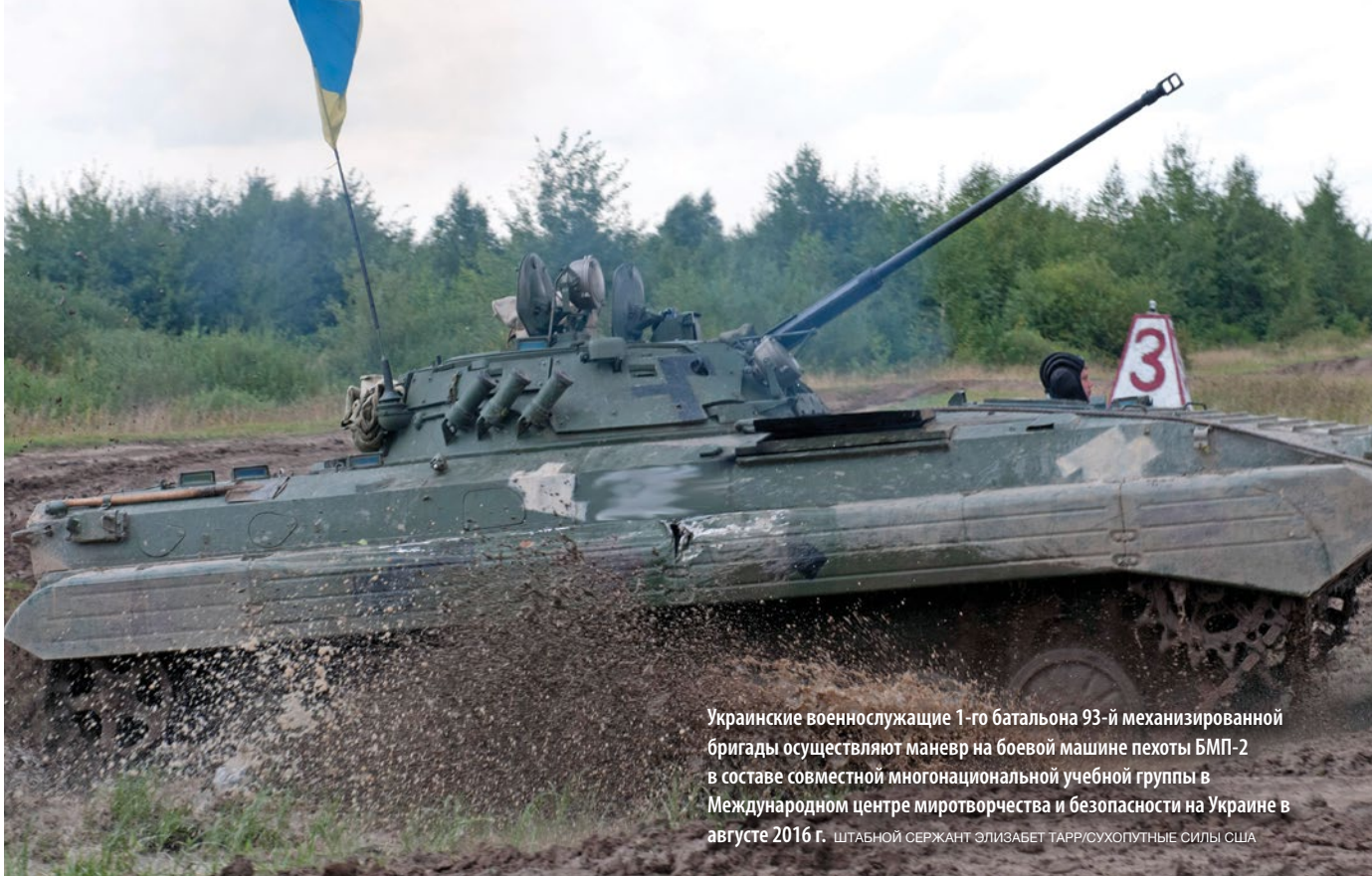
Украинские военнослужащие 1-го батальона 93-й механизированной бригады осуществляют маневр на боевой машине пехоты БМП-2 в составе совместной многонациональной учебной группы в Международном центре миротворчества и безопасности на Украине в августе 2016 г.

понимают важность языковой подготовки и хотят повысить свои знания языка, чтобы потом использовать их во время миротворческой деятельности и официального сотрудничества с иностранными партнерами.