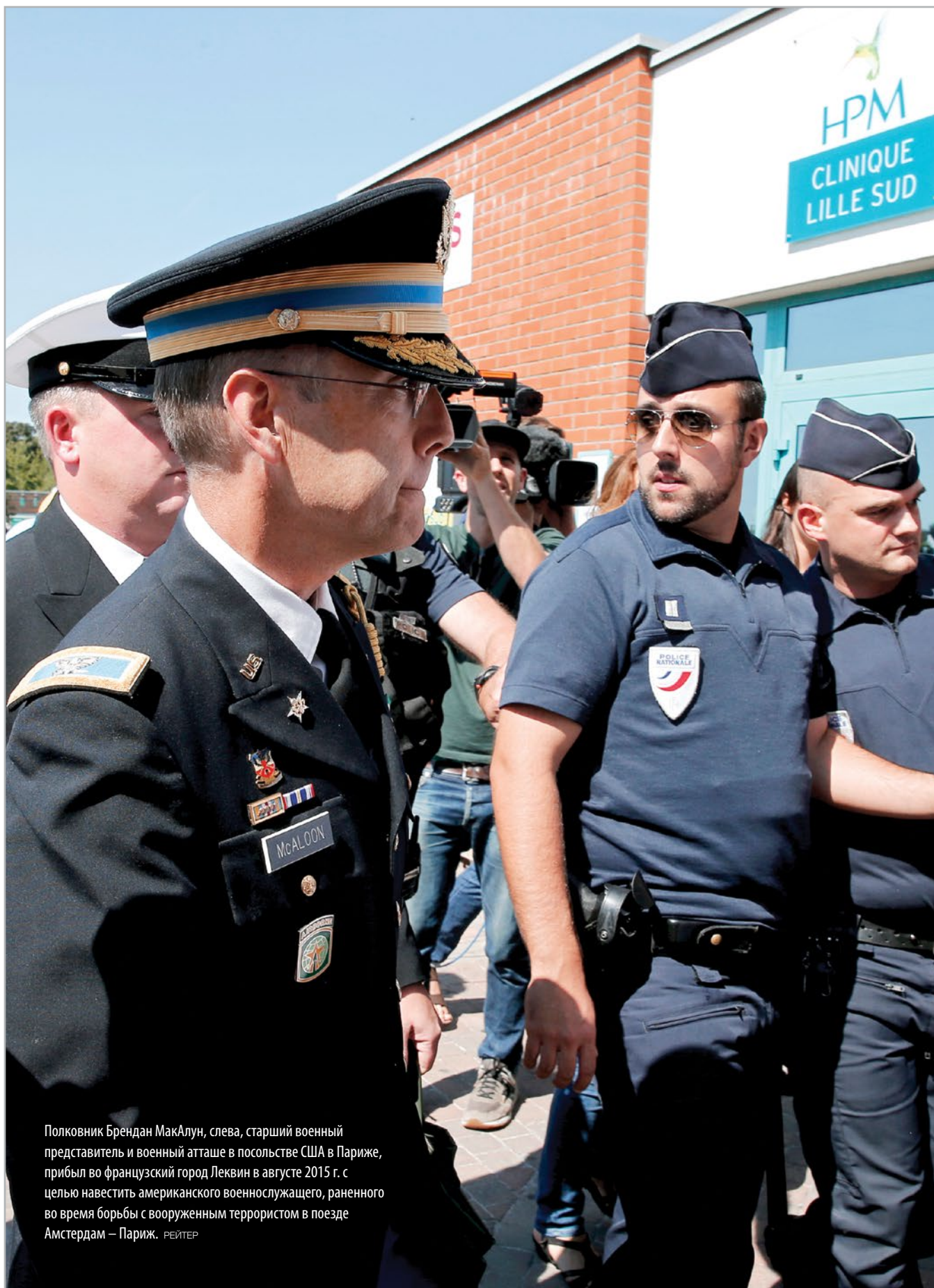
Полковник Брендан МакАлун, слева, старший военный представитель и военный атташе в посольстве США в Париже, прибыл во французский город Леквин в августе 2015 г. с целью навестить американского военнослужащего, раненного во время борьбы с вооруженным террористом в поезде Амстердам – Париж.