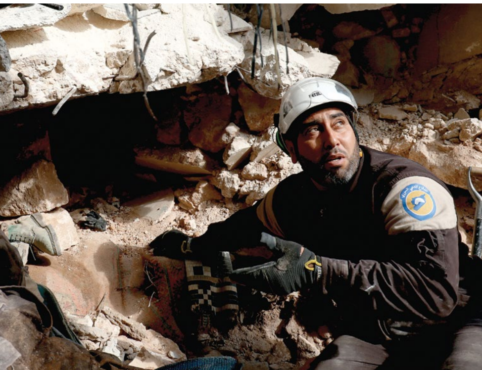
Боец гражданской обороны ищет под руинами пострадавших, оставшихся после авианалета на г. Идлиб в Сирии в декабре 2016 г.

Что действительно заставляет ЕС принимать ответные действия, так это отрицательные последствия «гибридных угроз» для европейской безопасности. Согласно оценке Европейской Комиссии, концепция гибридной угрозы определяется как «смесь принудительных и подрывных действий, конвенциональных и неконвенциональных методов (например, дипломатических, военных, экономических, технологических), координация которых может осуществляться государством или негосударственным образованием для достижения определенных целей, воздерживаясь при этом от открытого объявления войны». В последнее время эта концепция