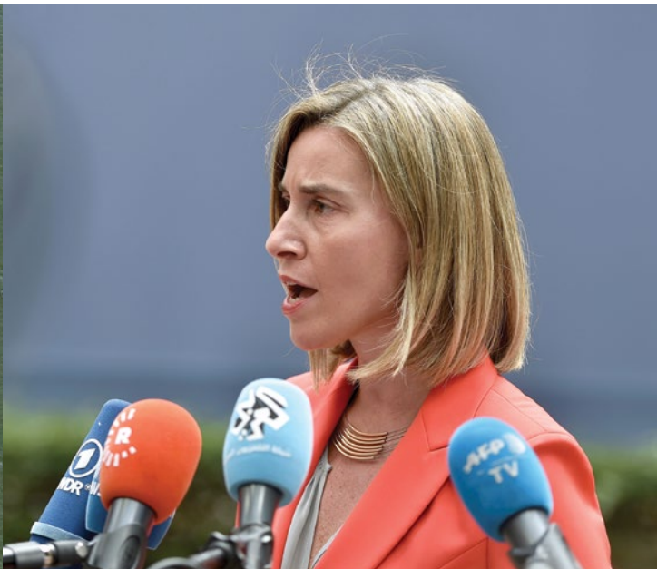
Презентация новой Глобальной стратегии ЕС Совету Европы 28 июня 2016 г., сделанная Верховным представителем ЕС по иностранным делам и политике безопасности Федерикой Могерини, была воспринята положительно.

По-видимому, всеобъемлющий подход к CSDP вместе со Стратегией внутренней безопасности должен включать в себя адекватное внимание к аспектам внутренней/территориальной обороны в дополнение к основной доктрине европейской внешней военной обороны. Основываясь на различных усилиях в области гражданской обороны, таких как создание Европейских сил гражданской обороны (для внешнего, но, возможно, и для внутреннего применения) в дополнение к гражданским инструментам, таким, как полиция, может быть создана координируемая ЕС национальная гвардия в качестве стратегического резерва во всех странах ЕС. Следует отметить, что такие подразделения,