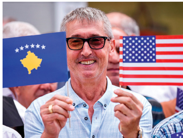
Мужчина держит флаги Косово и США на церемонии в Приштине в 2019 г., посвященной 20-летию вмешательства НАТО, расчистившего путь к независимости.

Но ассамблея СЕ избрала своим новым докладчиком по Косово Петера Бейера, члена ХДС от Германии. Это был первый случай, когда докладчиком Совета Европы был избран кандидат, поддерживаемый Косово, а это именно то, что нужно Косово. Конкуренция была ожесточенной, и в вопросе Косово затронула всю геополитику. Через тридцать лет после падения Берлинской стены Россия столкнулась с Германией в Косово, пытаясь навязать свое господство на Балканах и во всей Европе. Это была конфронтация между Востоком и Западом, между демократическими и авторитарными ценностями, прошлым и будущим, волей граждан Косово и интересами некоторых государств-членов. В такой многосторонней организации, как СЕ, с 47 государствами-членами, где Россия является членом и главным донором, а США-донором, но не членом и, следовательно, не имеют права голоса, это была непростая игра. Поражение Кондратьева было сигналом России о том, что не все можно купить и не всем можно манипулировать, особенно волей и желанием Косово и его решительной поддержкой евроатлантической