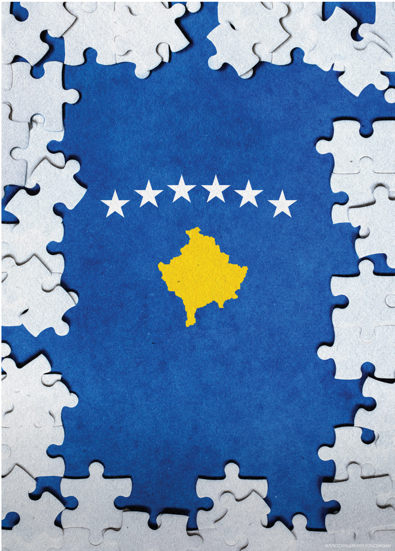
ИЛЛЮСТРАЦИЯ PER CONCORDIAM