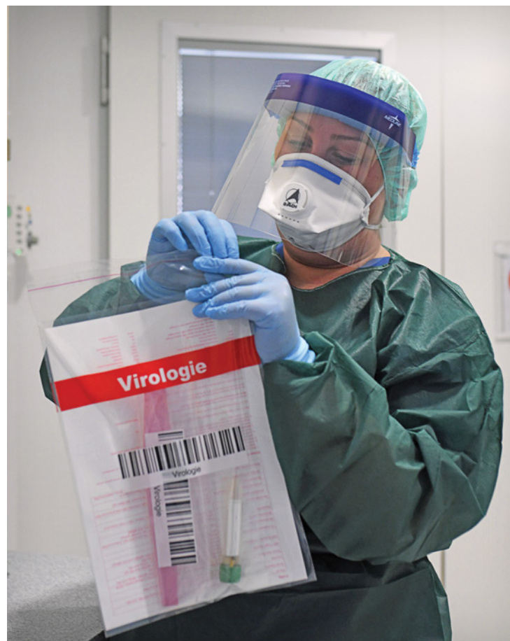
Медсестра в изоляционной палате университетской больницы в немецком г. Эссен запечатывает вирусологический пакет с медицинским образцом COVID-19. Март 2020 г.

Понятно, что эксперты в сфере интенсивной терапии ощущали необходимость снабдить врачей определенными инструкциями на пике пандемии, но в то же время было бы необходимым освободить их от уголовной ответственности за принимаемые решения. По практическим и логичным причинам общество должно ожидать, что национальная система здравоохранения