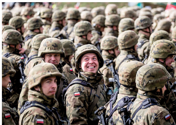
Польские солдаты собрались на церемонии приветствия натовских войск Усиленного передового базирования в г. Ожиш.

С тех пор многое изменилось. Экономический кризис привел к глобальной нестабильности, а сейчас на горизонте уже новый кризис. Россия стала более напористой и агрессивной, а Китай вырос и превратился в стратегического конкурента США. Великобритания покинула Евросоюз, а напряженность между членами ЕС из-за денег, влияния и