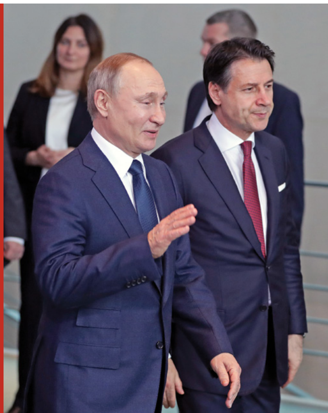
Российский президент Владимир Путин, слева, и премьер-министр Италии Джузеппе Конте прибывают на конференцию в столице Германии Берлине. Путин быстро откликнулся на призыв Конте о помощи Италии, сражавшейся с COVID-19.

аптек, а также школы, бары, рестораны и другие общественные учреждения, были закрыты. Экономика была заморожена, а люди были вынуждены оставаться дома и выходили на улицу только в строго оговоренных необходимых случаях. В наиболее сильно пострадавших регионах для пациентов с COVID-19 были возведены военные госпитали. В то же время создавалось впечатление, что ничто не в состоянии остановить или хотя бы замедлить рост числа случаев заболевания и смертей. Из-за того, что на кладбищах не было свободных мест, для перевозки тел умерших из Бергамо в другие города использовались транспортные средства итальянской армии. И вот когда разворачивался этот драматический сценарий, свою помощь предложила Россия. После телефонного разговора между премьер-министром Джузеппе Конте и Путиным 21 марта президент России без промедления продемонстрировал солидарность с Италией, на которую страны-члены ЕС оказались неспособными. Он отправил в Италию в рамках миссии «Из России с любовью» самолет с медицинскими товарами. Однако, стало очевидным, что среди отправленных материалов и оборудования не оказалось того, что было так необходимо Италии – систем вентиляции легких и средств индивидуальной защиты для врачей и медсестер. Вместо этого Кремль прислал экспертов и приборы для бактериологической дезинфекции и химической и биологической стерилизации.