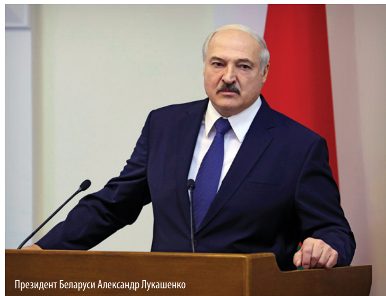
Президент Беларуси Александр Лукашенко

Путем уголовного преследования и ареста кандидатов и отказа зарегистрировать их в качестве кандидатов белорусские власти сумели нейтрализовать конкуренцию. Сергей Тихановский и Виктор Бабарико были посажены в тюрьму по обвинениям в нарушении общественного порядка и отмывании денег, соответственно. Цепкало, также, как и Тихановскому и Бабарико, было отказано в регистрации в качестве кандидата. Опасаясь