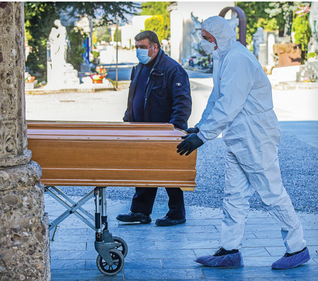
Служащий похоронного бюро в защитном костюме доставляет гроб на кладбище в г. Бергамо, Италия, в марте 2020 г., когда от COVID-19 ежедневного умирали сотни людей.

Отчаянная ситуация весны 2020 г. и рекомендации DVI вызвали дискуссии среди юристов и философских сообществ о том, как закон может регулировать принятие решений о медицинской сортировке. На первый взгляд, в соответствии с Уголовным кодексом Германии, решение врача об отказе или прерывании лечения может квалифицироваться как преступление: в Разделе 212, относящемся к умышленным и неумышленным убийствам, указано, что «Любое лицо, убившее человека, должно понести наказание в виде лишения свободы на срок минимум пять лет».