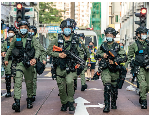
Полиция по охране общественного порядка патрулирует улицы во время антиправительственных митингов в Гонконге в знак протеста против закона о национальной безопасности, который многие считают попыткой Китая подавить демократические свободы.

а не служения его интересам. Неважно, кто это — президент России Владимир Путин, Лукашенко или председатель КНР Си Цзиньпин — у них есть одна общая черта — мотивация и действия, направленные на то, чтобы закрыть путь западным ценностям, угрожающим авторитарному правлению их странами. Хотя Берлинская стена пала 30 лет назад, разделение между Востоком и Западом остается. Тот факт, что Европейский союз не смог решить общеевропейскую проблему и интегрировать все страны, приверженные членству в ЕС, дал возможность восточному соседу выступить с определенными предложениями тем странам, которые остались вне ЕС, будь то финансовыми, политическими или военными.