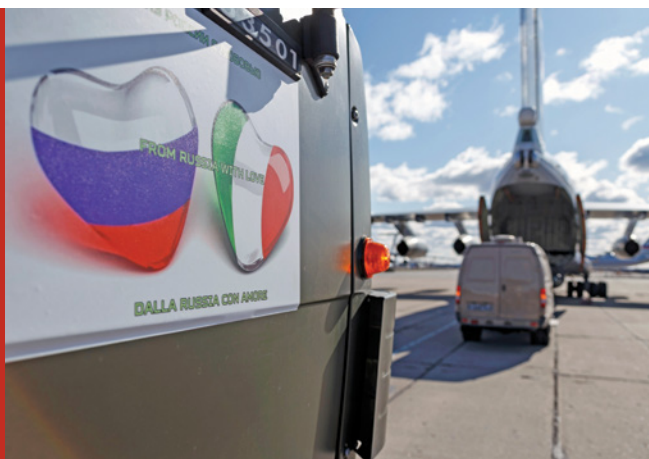
Медицинские товары под Москвой загружаются в грузовой самолет, готовящийся к вылету в Италию. Март 2020 г. На борту грузовика на английском и итальянском языках выведен лозунг «Из России с любовью».

с распространением коронавируса в Италии и других странах ЕС. Как считает Натали Точчи из итальянского «мозгового треста» Института международных отношений, закрытие национальных границ, разнородность принимаемых мер, отсутствие солидарности на начальном этапе пандемии, отсутствие, как это назвал бывший премьер-министр Италии Энрико Летта, «духа общины» и преобладание подхода «в первую очередь заботись о себе» отчетливо показали неспособность ЕС действовать слаженно в ситуации «победим или проиграем».