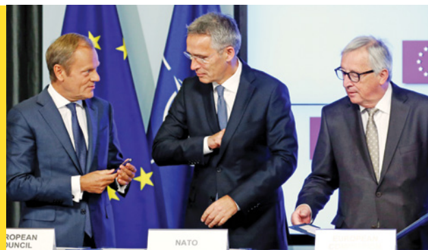
Слева направо – бывший в то время президентом Европейского совета Дональд Туск, генеральный секретарь НАТО Йенс Столтенберг и Жан-Клод Юнкер, бывший в то время президентом Европейской комиссии, подписывают новую совместную декларацию о сотрудничестве между ЕС и НАТО. Брюссель, июль 2018 г.