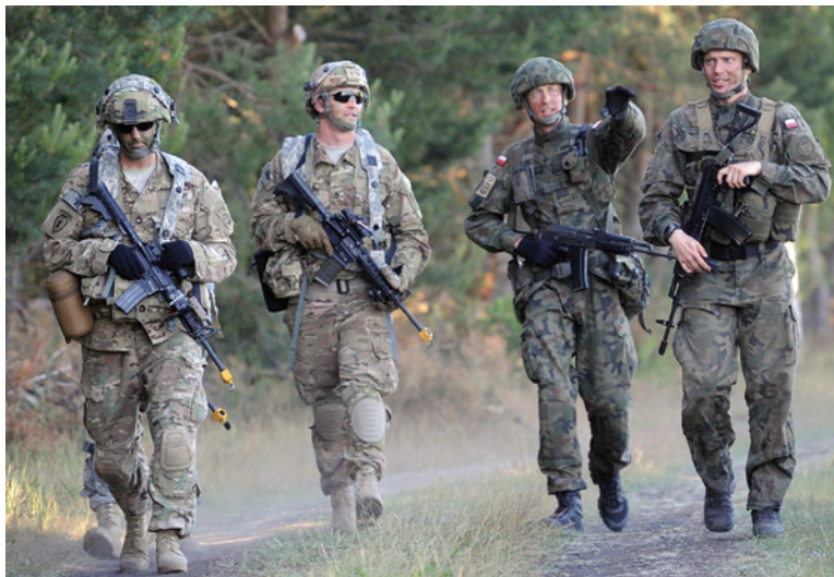
Парашютисты 82-й воздушно-десантной дивизии Сухопутных сил США и 6-й воздушно-десантной дивизии Польши участвуют в многонациональных учениях «Анаконда-2016» возле г. Торун в Польше.

В конечном счете учения «Анаконда-2016» подготовили условия для расширенного партнерства с Польшей и странами Прибалтики, которое НАТО еще больше укрепила на своем саммите в Варшаве в июле 2016 г., приняв решение о наращивании сил передового базирования. Согласно этому решению, в Польше, Эстонии, Латвии и Литве были размещены четыре многонациональных батальона – отдельно под командованием Германии, Великобритании, Канады и США – что явилось самым крупным наращиванием оборонных возможностей НАТО за последние несколько десятилетий. В свою очередь, Польша и прибалтийские страны подтвердили свои