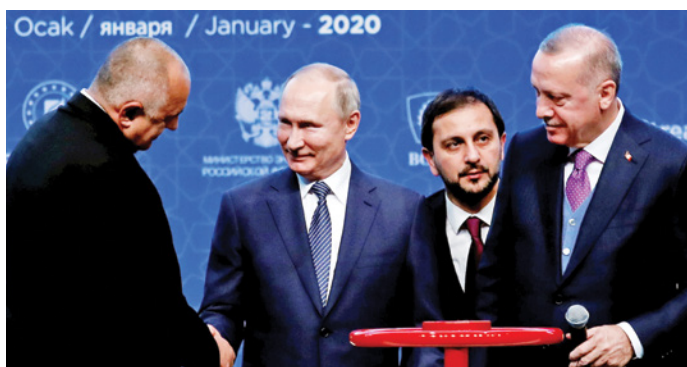
Российский президент Владимир Путин, второй слева, пожимает руку премьер-министру Болгарии Бойко Борисову в январе 2020 г. в присутствии президента Турции Реджепа Тайипа Эрдогана, справа, во время церемонии в Стамбуле по случаю официального открытия газопровода «Турецкий поток», по которому будет поставляться российский природный газ в Южную Европу через Турцию.

После незаконного присоединения Крыма произошел резкий сдвиг в отношениях между Европой и Путиным. Россия, со своей стороны, не колеблясь, стала извлекать выгоды из существовавшего к тому