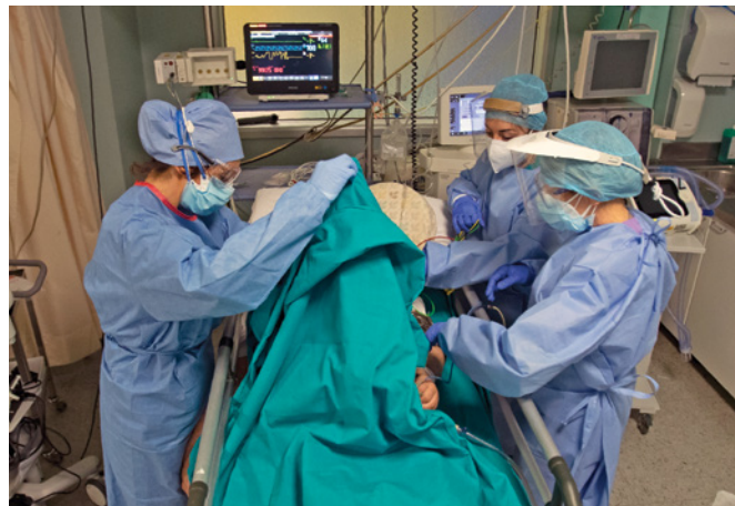
Медицинский персонал оказывает помощь пациенту в палате скорой помощи для больных COVID-19 в больнице «Сан Карло» в Милане, Италия.

Действия России требовали реакции со стороны