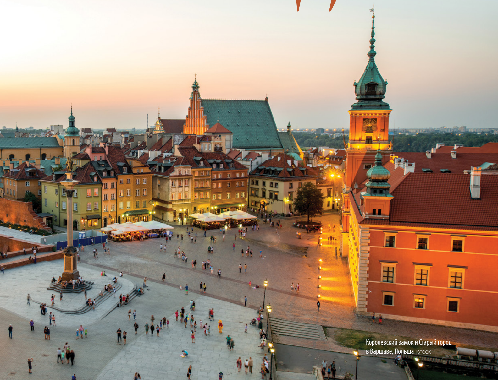
Королевский замок и Старый город в Варшаве, Польша